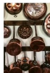
01. Dans la cuisine du 19 e s. 02. Grand escalier

« Le patrimoine est un témoignage social tout à fait exceptionnel. On lui doit un minimum de respect, à la fois pour le bâti lui-même, et pour ces hommes qui ont tant peiné à le construire. »