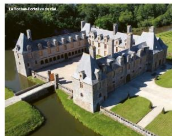
Le Rocher-Portail vu de ciel.

intérieurs seraient classés. Et la motion a été votée à l'unanimité! Les tapisseries ont même été classées « trésor national »! Il y a aussi une splendide galerie Renaissance, la pépinière de Bretagne, et le trône d'Anne de Bretagne. Le château possède un passage secret, donnant accès aux caves et à un long couloir menant jusqu'au pavillon du