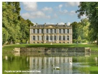
Façade du jardin avec le miroir d'eau.

En frais généraux d’entretien, sans compter les investissements, on atteint environ 240 000 € par an. Nous arrivons à nous autofinancer, à payer le personnel et à financer les